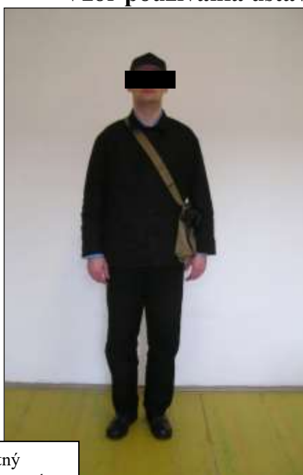
Letný pracovný odev