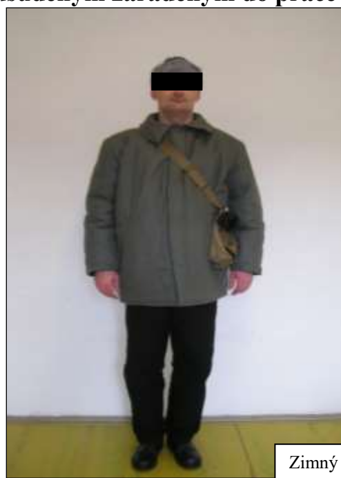
Zimný pracovný odev