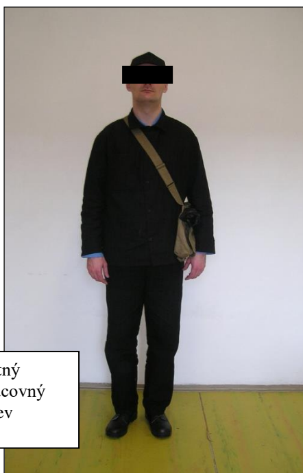
Letný pracovný odev