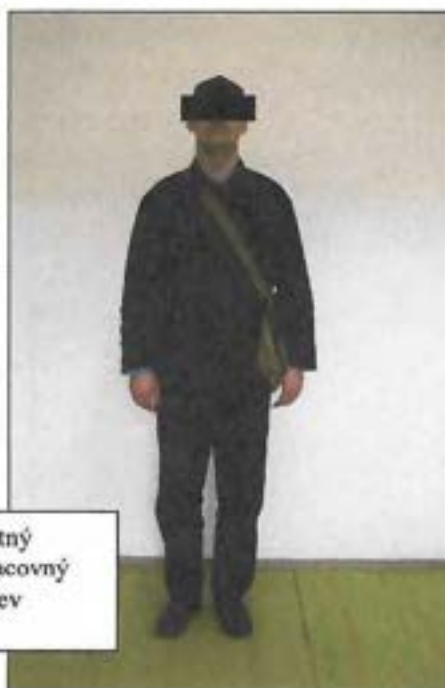
Letný pracovný odev