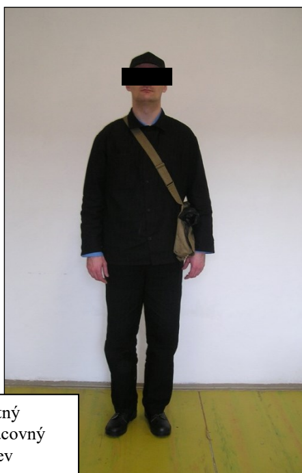
Letný pracovný odev