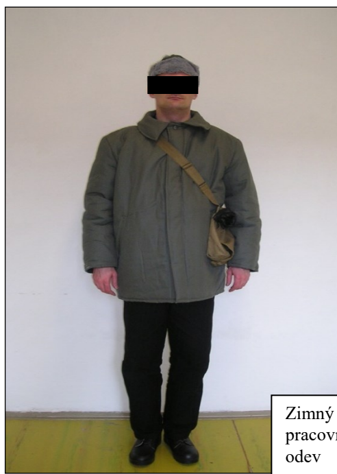
Zimný pracovný odev