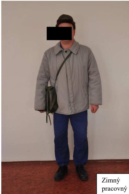
Zimný pracovný odev