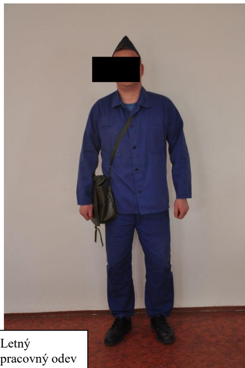
Letný pracovný odev