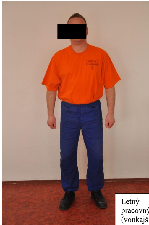
Letný pracovný odev (vonkajšie pracoviská)