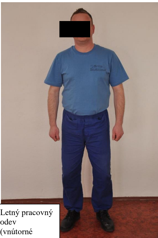
Letný pracovný odev (vnútorné pracoviská)