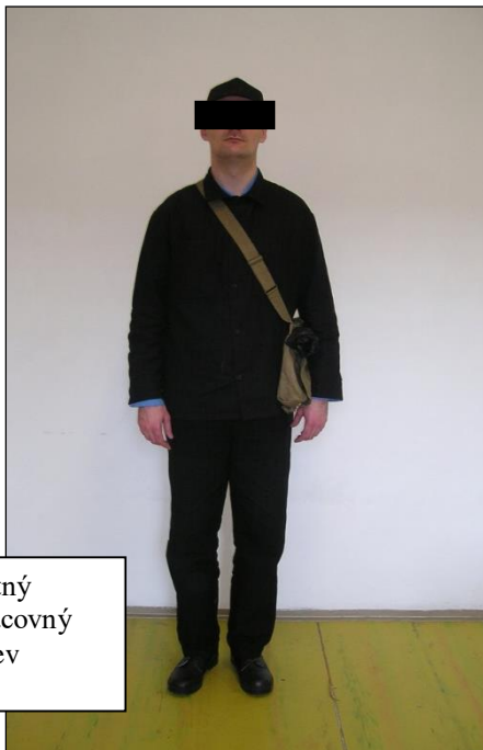
Letný pracovný odev