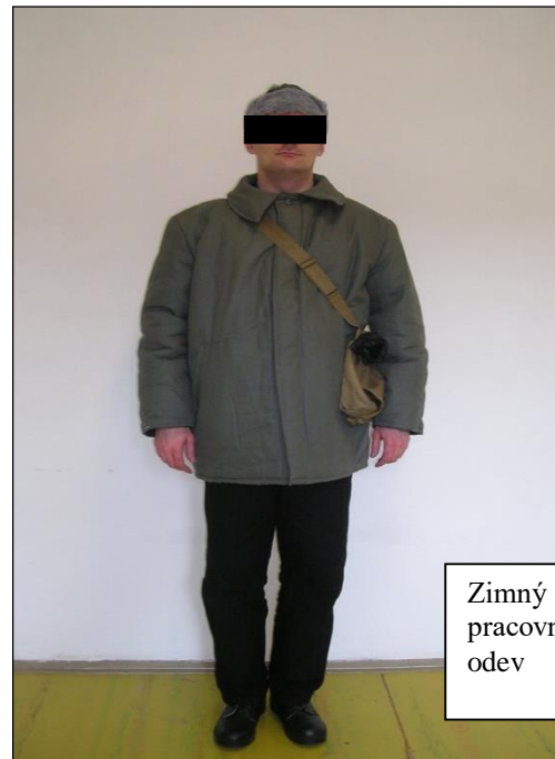
Zimný pracovný odev