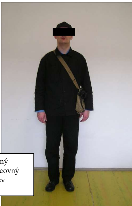
Letný pracovný odev