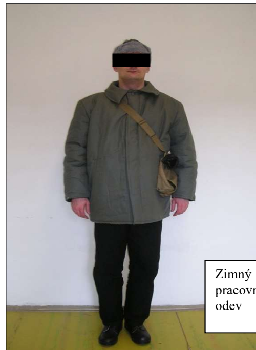
Zimný pracovný odev